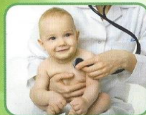
дети младше 5 лет