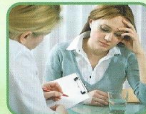
дети и взрослые с хроническими заболеваниями